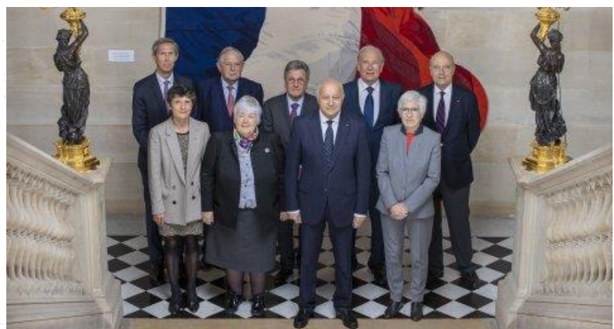
Les membres du Conseil constitutionnel (2023).