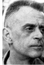
Maurice DUVERGER (1917-2014)