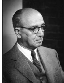
Hans KELSEN (1881-1973)