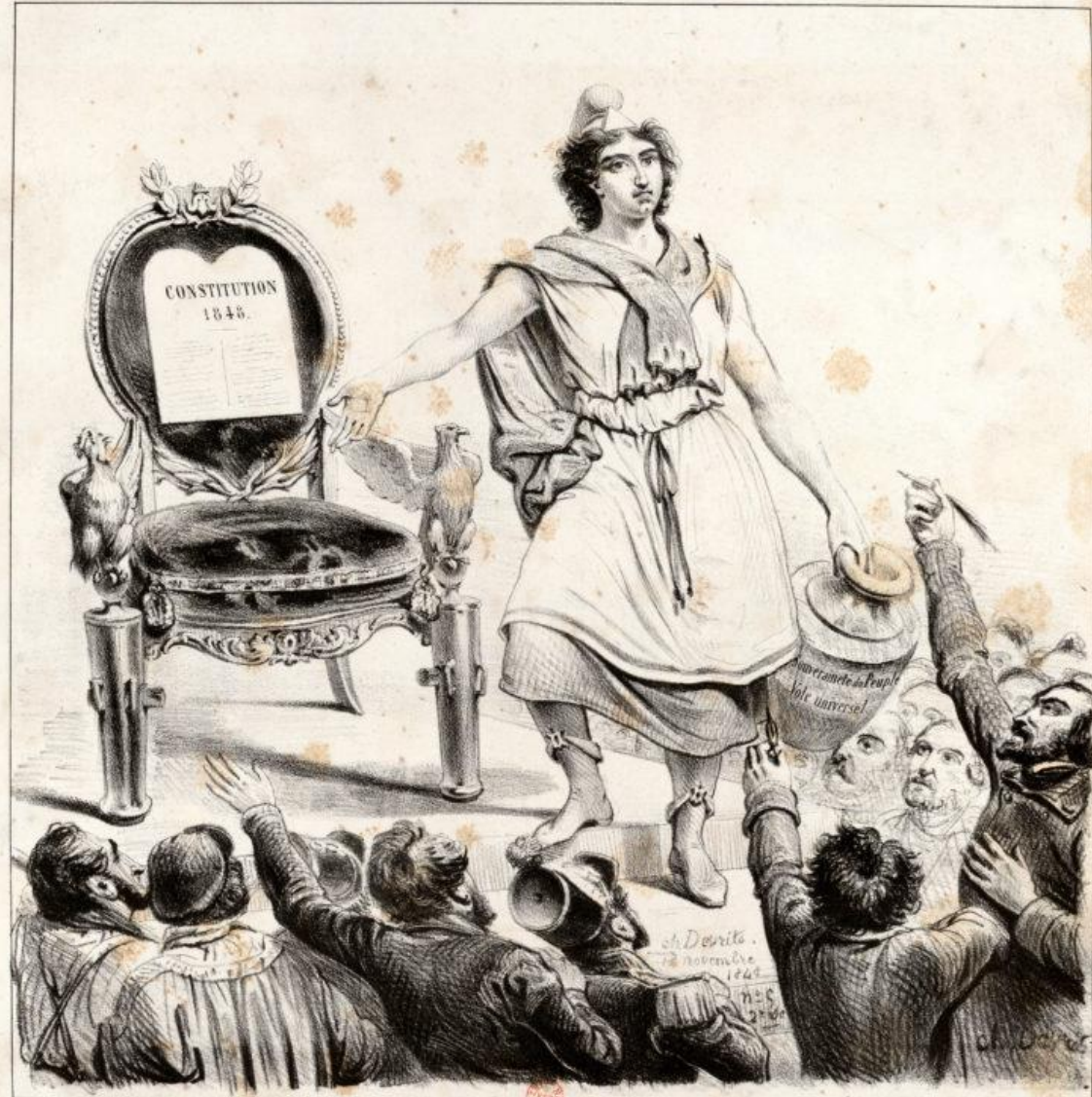
LA RÉPUBLIQUE AU PEUPLE

§1. Et si le peuple n'était qu'un incident ?